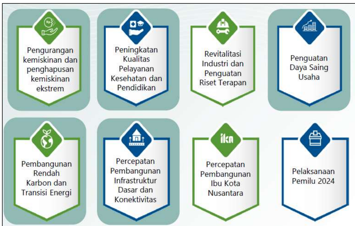
Gambar 3.1 Arah Kebijakan RKP Tahun 2024

Pada Tahun 2024, Tema Pembangunan Nasional yang ditetapkan dalam RKP Tahun 2024 adalah "Mempercepat Transformasi Ekonomi yang Inklusif dan Berkelanjutan" dengan 8 arah kebijakan sebagai berikut: